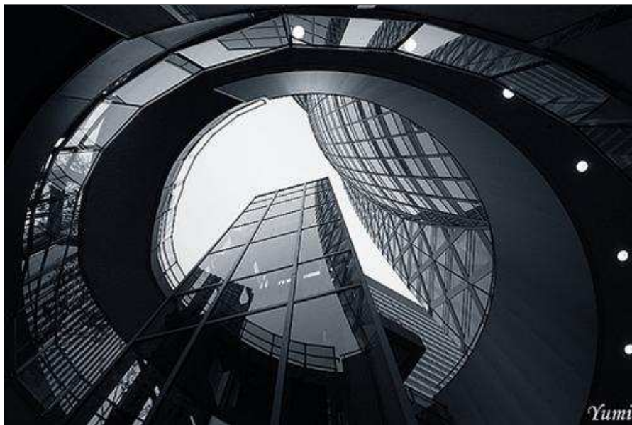
Lối bên trong tòa nhà, phòng học được uốn lượn xung quanh đây

Từ tầng 1 đến tầng 50, những khu vực phòng học vuông vức được sắp xếp thành hình cong uốn theo lối bên trong tòa nhà. Lối bên trong này gồm hệ thống thang máy, thang bộ và ống thông gió. Giữa những phòng học là không gian dành cho sinh viên như "sân trường nội bộ". Mảng xanh ở mỗi tầng phá vào vào khối bê tông cốt thép đồ sộ này chút hơi hướm thiên nhiên tươi mát cũng là một "kỹ xảo" nhằm đem lại cảm giác thư thả cho sinh viên sau những buổi học căng thẳng, tạo hưng phấn cho cảm xúc sáng tạo, thăng hoa.