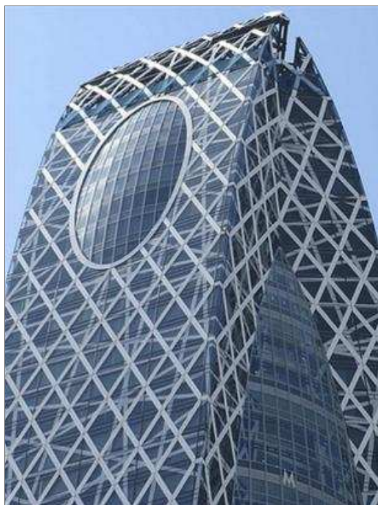
Đỉnh tháp nhọn như một ngòi viết - biểu tượng đặc trưng của ngành giáo dục

Hỗn hợp nhôm trắng và kính xanh bên ngoài cấu trúc đan chéo vào nhau như lớp lưới bao phủ cái kén. Sự phối hợp này phản ánh khả năng kỹ thuật đương đại, cho phép hạn chế khả năng hội tụ ánh sáng cao xuyên qua lớp kính, do đó chỉ có một lượng ánh sáng mỏng và vừa phải chiếu vào bên trong các lớp học; đồng thời cũng thể hiện một phép ẩn dụ đầy thi vị về hình ảnh một cái kén.