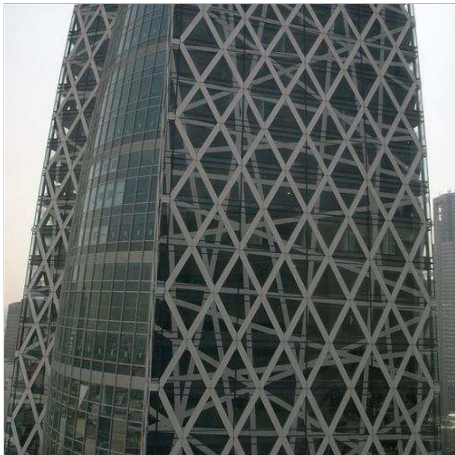
Kết cấu thép đan chéo bọc ngoài lớp kính xanh, vừa tạo hình ảnh của lớp lưới bao bọc xung quanh cái kén vừa có công năng cản ánh sáng

Kiến trúc được thiết kế theo chiều thẳng đứng có sức chứa hơn 10.000 sinh viên, cao 204m với 50 tầng bên trên và 3 tầng hầm bên dưới. Đây là công trình giáo dục cao thứ hai trên toàn thế giới (chỉ đứng sau Đại học Moscow) và cao thứ 17 ở Nhật.