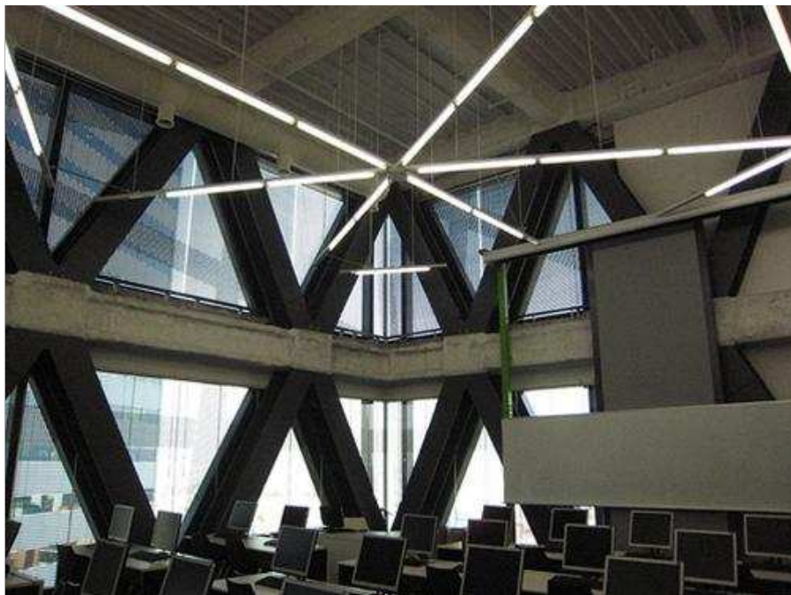
Một lớp học