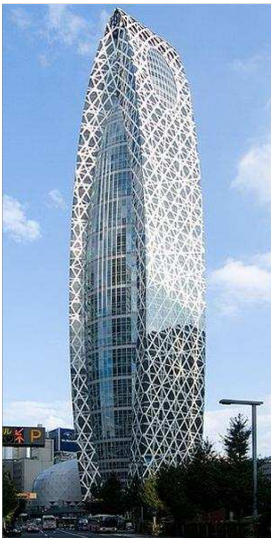
Kết cấu và ý tưởng dựa theo thuyết con nhộng và cái kén làm nên nét riêng biệt của học viện