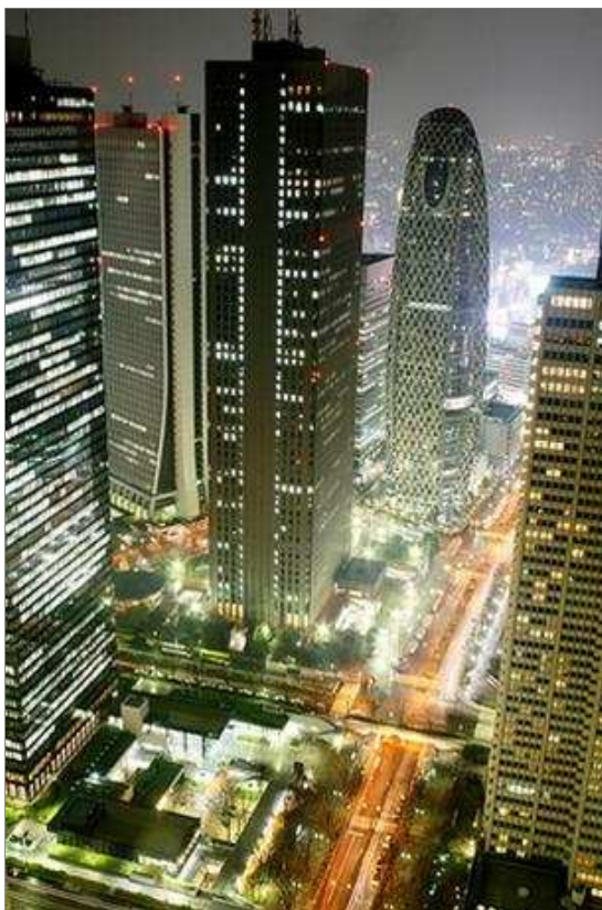
Tòa nhà nổi bật trong ánh đèn đêm

Toàn bộ kiến trúc gồm 3 phân khu học viện liên kết với nhau. Đó là Trường Đào tạo thiết kế thời trang Tokyo, Trường công nghệ thông tin - kỹ thuật số Tokyo HAL và Trường Shuto Iko chuyên ngành chẩn đoán và khám chữa bệnh.