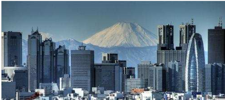
Học viện Cocoon nổi bật với hình dáng cái kén trong trung tâm hành chính Nishi Shinjuku - thủ phủ những tòa nhà chọc trời của Nhật - phía sau là núi Phú Sĩ hùng vĩ

TTO - Học viện Cocoon, tọa lạc tại khu trung tâm hành chính Nishi Shinjuku thuộc thủ đô Tokyo, được xem là một biểu tượng cho lối thiết kế cách tân và biệt lệ của ngành giáo dục Nhật Bản nói riêng và cả thế giới nói chung.