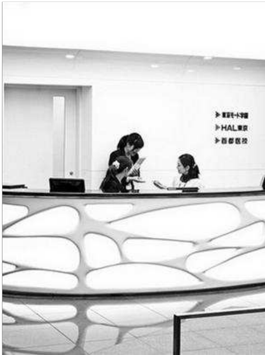
Hành lang của học viện

Từ tầng 1 đến tầng 50, những khu vực phòng học vuông vức được sắp xếp thành hình cong uốn theo lối bên trong tòa nhà. Lối bên trong này gồm hệ thống thang máy, thang bộ và ống thông gió. Giữa những phòng học là không gian dành cho sinh viên như "sân trường nội bộ". Mảng xanh ở mỗi tầng phá vào vào khối bê tông cốt thép đồ sộ này chút hơi hướm thiên nhiên tươi mát cũng là một "kỹ xảo" nhằm đem lại cảm giác thư thả cho sinh viên sau những buổi học căng thẳng, tạo hưng phấn cho cảm xúc sáng tạo, thăng hoa.