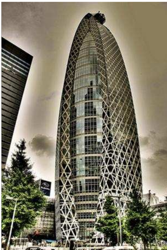
Một môi trường hoàn hảo kích thích sự sáng tạo và khả năng tư duy của sinh viên