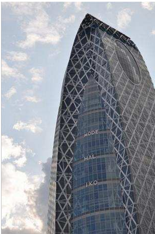
Tòa nhà Cocoon gồm 3 học viện với những chuyên ngành khác biệt

Dù lọt thỏm trong khu Nishi Shinjuku - vốn được mệnh danh là “rừng của những tòa nhà chọc trời” - nhưng Học viện Cocoon lại mang một dáng dấp không lẫn vào đâu được. Kiểu cách dị thường với bề ngoài mang hình dáng của một “cái kén” là nét tiêu biểu cho sự độc đáo cả về thiết kế lẫn ý tưởng.