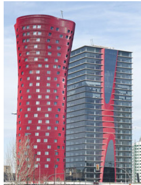
#1 Hotel Porta Fira (Spain)

Der drittplatzierte Tour CMA CGM in Marseille, gelobt wegen seiner Modernität und Symbolkraft für die Erneuerung der Stadt an der Mittelmeerküste, liegt nur 500 Kilometer vom Sieger entfernt.