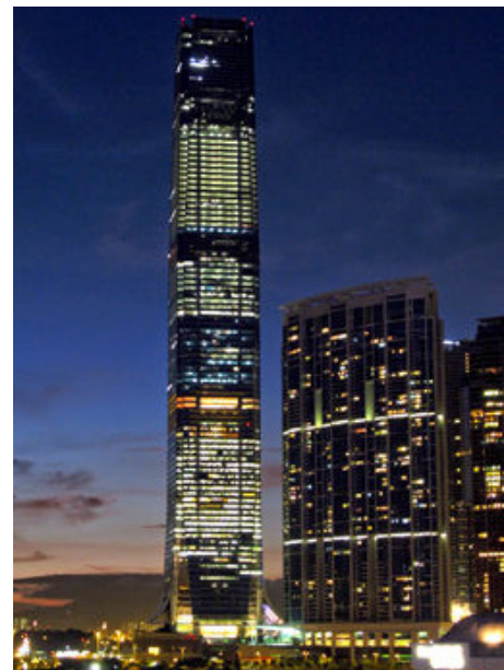
#10 Int. Commerce Centre (China)