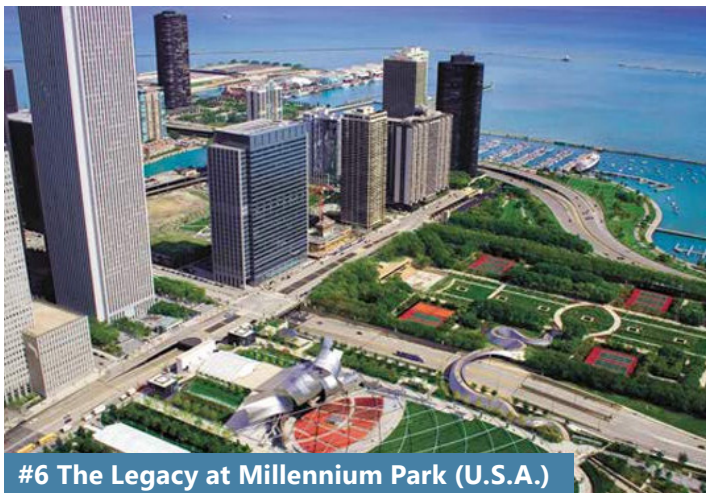
#6 The Legacy at Millennium Park (U.S.A.)