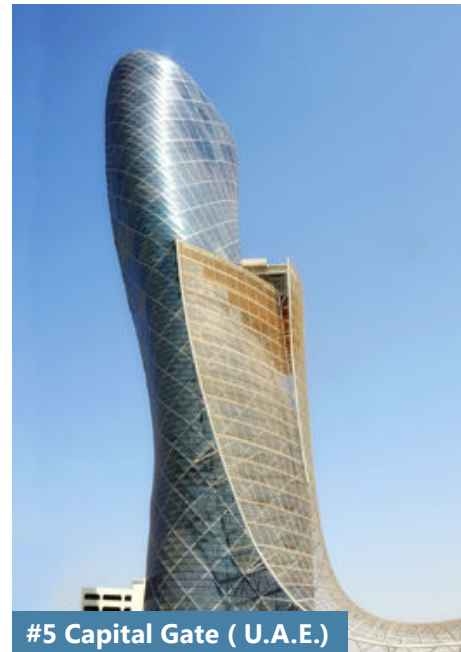
#5 Capital Gate ( U.A.E.)

Der Emporis Skyscraper Award ist der einzige Hochhaus Architekturpreis, der seit dem Jahr 2000 jährlich auf weltweiter Basis vergeben wird. Maßgebliche Kriterien dabei sind die Ästhetik der Gestaltung und Funktionalität der Wolkenkratzer. Die Jury setzt sich aus Architekturexperten aus 67 Nationen zusammen. Frühere Gewinner der Auszeichnung waren das Kingdom Centre in Riad (2002), der Turning Torso in Malmö (2005), der Hearst Tower in New York City (2006), der Cocoon Tower in Tokio (2008) und das Aqua in Chicago (2009). Emporis ist mit über 400.000 Gebäuden aus 60.000 Städten in allen Ländern einer der größten Anbieter von globalen Gebäudeinformationen