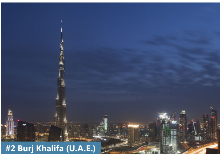
#2 Burj Khalifa (U.A.E.)