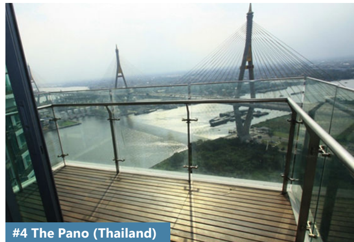
#4 The Pano (Thailand)