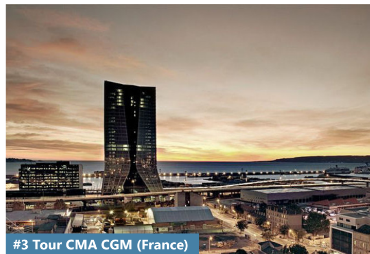
#3 Tour CMA CGM (France)