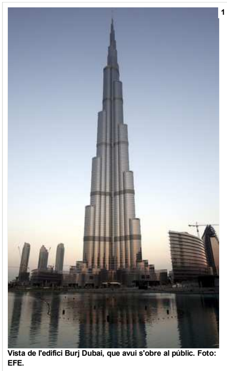
Vista de l'edifici Burj Dubai, que avui s'obre al públic.

Abans de la inauguració, un dels directors d'Emaar, Muhammad al-Abbar, va dir ahir als periodistes que el 90 per cent del Burj Dubai «ja està venut», cosa que s'espera que beneficiarà el mercat immobiliari de l'emirat, que travessa una crisi financera. I és que la inauguració de la torre coincideix amb la crisi financera que afronta