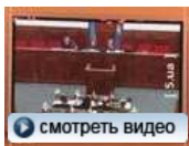
Черновецкий роздал портфели