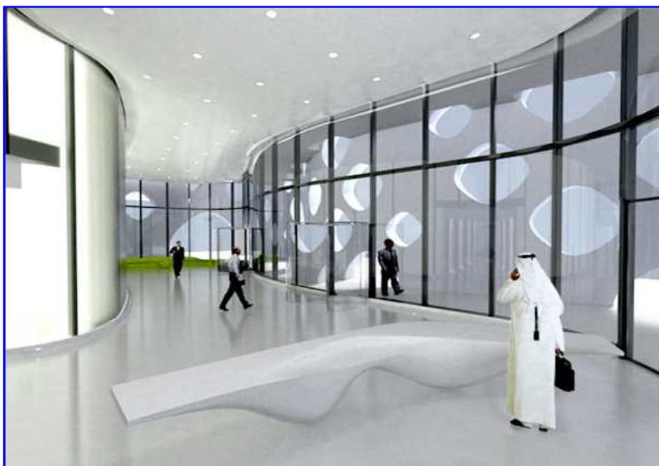
Третото място остана за 69-етажния жилищен комплекс The Met в столицата на Тайланд.