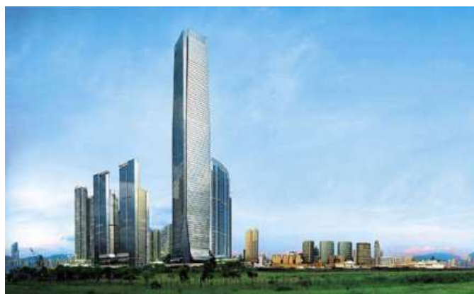
Le futur Ritz-Carlton de Hong-Kong