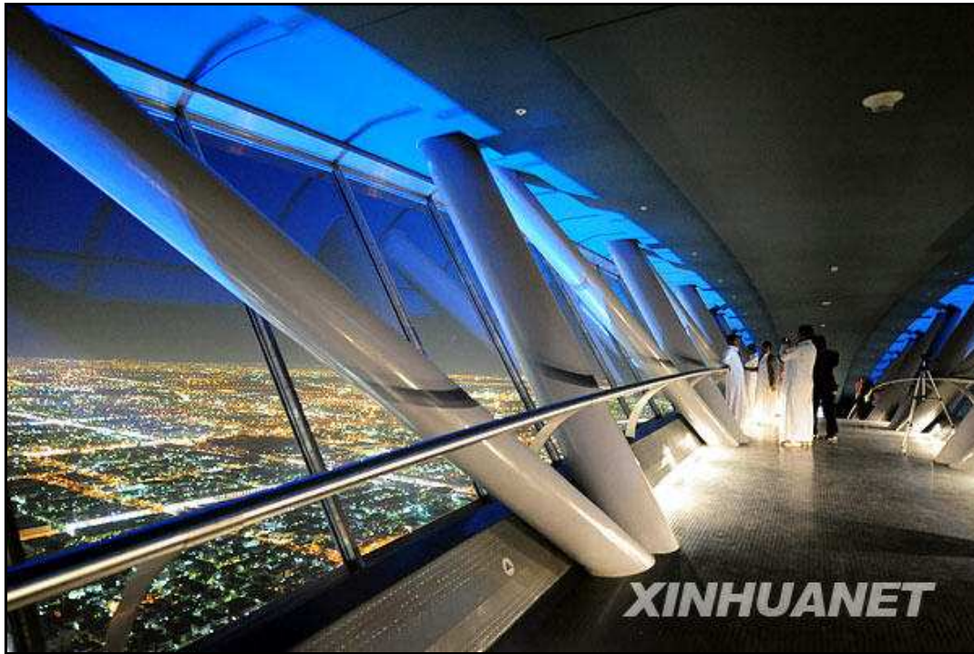
几名游客正在沙特阿拉伯首都利雅得的王国大厦楼顶的观光走廊观看夜景

声明：中国建筑艺术网刊载此文不代表同意其说法或描述，也不代表推荐其学术观点，仅为客观提供更多信息用。凡本网注明“来源：中国建筑艺术网”字样的所有文字、图片和音视频稿件，版权均属中国建筑艺术网所有，其他媒体或个人在下载使用时必须注明“来源：中国建筑艺术网”，违者本网将依法追究。对于未注明“来源：中国建筑艺术网”字样的所有文字、图片和音视频稿件，其他媒体或个人从本网下载使用，必须保留本网注明的稿件来源，并自负版权等法律责任。本网站有部分文章是由网友自由上传，对于此类文章本站仅提供交流平台，不为其版权负责。如对稿件内容有疑议，或您发现本网站上有侵犯您的知识产权的文章，请您速来电或来函与中国建筑艺术网联系。